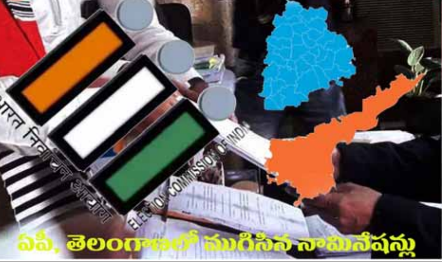
ఏపీ, తెలంగాణలో ముగిసిన నామినేషన్లు

హైదరాబాద్ : ఏపీ అసెంబ్లీ 175 స్థానాలకు, 25 లోక్ సభ స్థానాలకు, తెలంగాణలో 17 లోక్ సభ, సికింద్రాబాద్ కంటోన్మెంట్ అసెంబ్లీ ఉప ఎన్నికల నిర్వాహణలో నామినేషన్ల దాఖలు ఘట్టం గురువారం మధ్యాహ్నం 3 గంటలకు ముగిసిపోయింది. ఈ నెల 18వ తేదీన ఎన్నికల నోటిఫికేషన్ విడుదల కాగా 18వ తేదీ నుంచి 25 వ తేదీ వరకు నామినేషన్లు స్వీకరించారు. నేడు శుక్రవారం నామినేషన్ల పరిశీలన, తిరస్కరణ.. 29న ఉపసంహరణ ప్రక్రియ కొనసాగనుంది. మే 13న పోలింగ్ నిర్వహించి జూన్ 4 ఓట్లు లెక్కించి ఫలితాలను వెల్లడించనున్నారు. ఏపీలో 175 అసెంబ్లీ స్థానాలకు 4,384 నామినేషన్లు దాఖలయ్యాయి. 25 లోక్ సభ స్థానాలకు 763 నామినేషన్లు దాఖలయ్యాయి. ఇకపోతే తెలంగాణలోని 17 లోక్ సభ స్థానాలకుగాను 547 నామినేషన్లు దాఖలయ్యాయి. చివరి రోజు ప్రధాన పార్టీలతో పాటు స్వతంత్ర అభ్యర్థులు భారీ సంఖ్యలో నామినేషన్లు దాఖలు చేశారు. అత్యధికంగా మల్కాజ్గిరి లోక్ సభ స్థానానికి 101 నామినేషన్లు దాఖలయ్యాయి. నల్లగొండలో 85 నామినేషన్లు, భువనగిరిలో 81, నిజామాబాద్ లో 77, పెద్దవల్లిలో 74, కరీంనగర్ లో 69, వరంగల్ లో 62, సికింద్రాబాద్ 60, చేవెళ్లలో 59, ఖమ్మంలో 57, మెదక్ లో 55, హైదరాబాద్ లో 48, జూబిలీహిల్స్ లో 41, మహబూబ్ నగర్ లో 42, ఆదిలాబాద్ లో 39, మహబూబాబాద్ లో 32, నాగర్ కర్నూల్ లో 23 నామినేషన్లు దాఖలైనట్లుగా సమాచారం. ఉప ఎన్నిక జరుగుతున్న సికింద్రాబాద్ కంటోన్మెంట్ అసెంబ్లీ స్థానానికి 38 నామినేషన్లు దాఖలయ్యాయి.