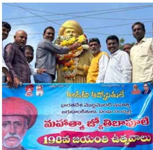
అందరికీ ఆదర్శనీయమన్నారు. పూలే జీవితం ఆదర్శనీయమన్నారు.