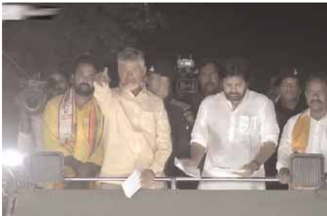
అధికంగా ముందుకు తీసుకువస్తాం. ఇదే కాదు... స్థానిక సంస్థల్లో మళ్ళీ 34 శాతం బీసీ రిజర్వేషన్లు తీసుకువస్తాం. చట్టసభల్లోనూ బీసీ రిజర్వేషన్లు కోసం పోరాడుతాం, న్యాయం జరిపిస్తాం, తీర్మానం చేస్తాం. చట్టబద్ధంగా కులగణన చేస్తాం. బీసీల రక్షణ కోసం ప్రత్యేక చట్టం తీసుకువస్తాం. ఆదరణ కోసం రూ.5 వేల కోట్లు ఖర్చు పెడతాం. చంద్రన్న బీమా రూ.10 లక్షలు చేసి బాధ్యత తీసుకుంటాం.

ఒక చాన్స్ అంటే నమ్మి అందరూ ఓటేశారు... మీలో బాధ, ఆవేదన చూశాను... మీలో అభిద్రతా భావం కనిపిస్తోంది.... ఇవాళ, నేను పవన్ కల్యాణ్ ఇక్కడికి వచ్చింది మీ జీవితాల్లో వెలుగులు నింపేందుకు... సిద్ధం సిద్ధం అంటున్న వాళ్లకు మర్చిపోలేని యుద్ధం ఇద్దామని మిత్రుడు పవన్ కల్యాణ్ చెప్పారు... దానికి మీరు సిద్ధమా? అని అడిగారు. జగన్ ఒక్క డీఎస్సీ ఇవ్వలేదని, ఉద్యోగాలు ఊసేలేదని ఆవేదన వ్యక్తం చేశారు. జగన్ అన్ని రంగాలను కోలుకోలేని దెబ్బ తీశారని ఆందోళన వ్యక్తం చేశారు. పోలీసులకు ఇవ్వాలని నిధులను ఎందుకు ఇవ్వలేదని ప్రశ్నించారు. దళితులకు సంబంధించిన 27 సంక్షేమ పథకాలు జగన్ రద్దు చేశారని విరుచుకుపడ్డారు. దళితులకు విదేశీ విద్య రద్దు చేశారన్నారు. 6 వేల మంది దళితులపై కేసులు పెట్టారని వాపోయారు. 186 మంది దళితులను హత్య చేశారని ఆవేదన వ్యక్తం చేశారు. మాదిగలకు ఎమ్మెల్యే ఇచ్చి సామాజిక న్యాయం చేస్తామని భరోసా ఇచ్చారు. కావులకు న్యాయం చేస్తామని మాటిచారు. అంటే దుర్భేద కోసనీమ జిల్లాలో వరదల సమయంలో ప్రజలకు ఇబ్బంది లేకుండా చర్యలు చేపడతామని చెప్పారు. కొబ్బరి పరిశ్రమలు ఏర్పాటుచేసి పూర్తి వైభవం తీసుకువస్తామని చంద్రబాబు హామీ ఇచ్చారు. ఈ ముఖ్యమంత్రి ఓ తమాషా అట అడుతున్నాడు... పవన్ కల్యాణ్ ఎప్పుడైనా మాట్లాడితే ఆయనపై ఆ కులం వాళ్లతో మాటల దాడి చేయిస్తాడు... నేను మాట్లాడితే నా కులం వాళ్లకు ఎగదోసి బాతులు తిట్టిండా... అందుకే చెబుతున్నా... మీరు కొట్టి దెబ్బ జగన్ కు అదిరిపోవాలి... మళ్ళీ ఇంట్లోంచి బయటికి రాకుండా చిత్కోట్టండి... అంటూ చంద్రబాబు పిలుపునిచ్చారు.