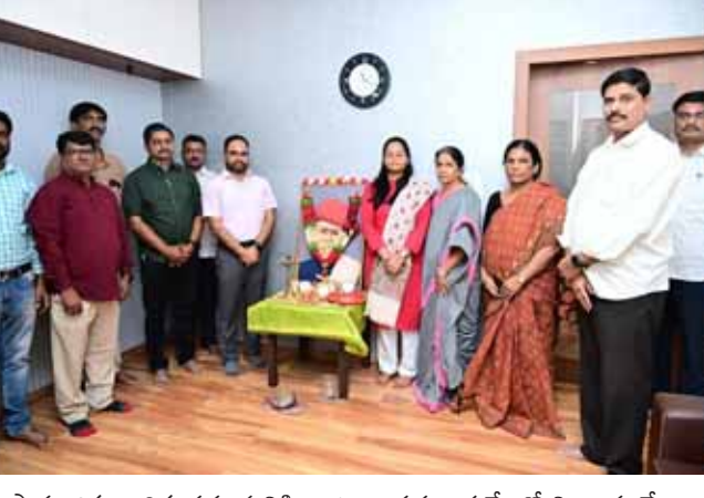
సామాజిక, ఆర్థిక సమస్యలకు బాటలు పడతాయనే జ్యోతిరావు పూలే ఆలోచన విధానాన్ని అందరు స్ఫూర్తిగా తీసుకోవాలని అన్నారు. ఆయన న హచరి సావిత్రీ బాయి పూలేకు గురువుగా మారి ఉన్నత విద్యావంతురాలిగా తీర్చిదిద్ది, ఎంతో మంది మహిళలకు సావిత్రీ బాయిచే విద్య నేర్పించారని, చరిత్రలో సావిత్రీబాయి మొట్టమొదటి మహిళా ఉ