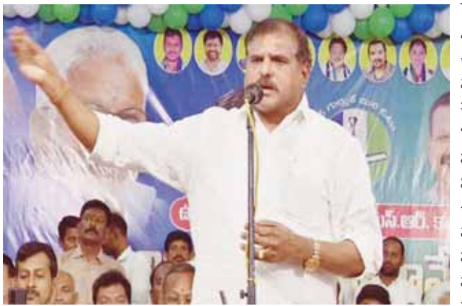
వ్యవసాయ రంగం కూడా అభివృద్ధి బాటలో ఉందని చెప్పారు. చెప్పుకోవడానికి ఏమీ లేక ప్రభుత్వంపై చంద్రబాబు బురద చల్లుతున్నారని విమర్శించారు. చంద్రబాబును నమ్మే పరిస్థితిలో ఎవరూ లేరని చెప్పారు. మన పార్టీలో ఉన్న అసమ్మతి నేతలను పట్టించుకోవద్దని... అలాంటి నాయకులు వెళ్లిపోయినా మనకు వచ్చే నష్టం ఏమీ లేదని అన్నారు. జగన్ నాయకులను నమ్ముకోలేదని... ప్రజలను నమ్ముకున్నారని చెప్పారు. ఇదే సమయంలో పురందేశ్వరిపై బొత్తు విమర్శలు గుప్పించారు. ఐఎఎస్, ఐపీఎస్ అధికారులపై పురందేశ్వరి ఈసీకి లేఖలు రాస్తున్నారని... హెరిటేజ్ సంస్థ మేనేజర్లు

చిన్న చిన్న మనస్సుర్లులు ఉన్న వాటిని పక్కన పెట్టి పనిచేయాలని పిలుపునిచ్చారు. "మునపై వచ్చే వ్యతిరేక వార్తలు, ప్రచారాలను తిప్పికోట్లాది. ఈ రోజున మీడియా కన్నా... సోషల్ మీడియా పవర్ ఫులోగా ఉంది. సోషల్ మీడియా ద్వారా మన ప్రచారం పెంచండి. రాష్ట్రంలో పేదరికం ఐదేళ్లలో గణనీయంగా తగ్గింది. వ్యవసాయం కూడా అభివృద్ధి బాటలో ఉంది. అన్ని వ్యవస్థల్లో సమూహ మార్పులు చేసి ఇతర రాష్ట్రాలను వెనక్కి నెట్టి ముందు వరసలోకి వచ్చాం. చంద్రబాబు హయాంలో కూటమి దోపిడీ, దౌర్జన్యాల కూటమి. చంద్రబాబుకి చెప్పుకోవడానికి ఏమిలేక మంద జబ్బుతున్నారు. ఆయనలాగా జగన్ పేజీలు పేజీలు మేనిఫెస్టో హామీలు ఇవ్వలేదు. ఇచ్చిన మాటను, హామీని నెలబెట్టకాని ఓటు అడుగుతున్న విక్షేత వ్యక్తి సీఎం జగన్" అని మంత్రి బొత్త అన్నారు. పార్టీ కోసం కష్టపడే వారికి ఇవ్వాలని గౌరవాన్ని, పదవులను వచ్చే ఐదేళ్లలో ఇస్తామని బొత్తు హామీ ఇచ్చారు. మీరంతా కష్టపడితేనే అధికారంలోకి వస్తామని చెప్పారు. మన మీద వచ్చే వ్యతిరేక వార్తలను, ప్రచారాలను తిప్పికోట్లాది... సోషల్ మీడియా ద్వారా మన ప్రచారాన్ని పెంచాలని అన్నారు. ఈరోజున మీడియా కంటే సోషల్ మీడియానే పవర్ ఫులో గా ఉందని చెప్పారు. గత ఐదేళ్ల జగన్ పాలనలో రాష్ట్రంలో పేదరికం గణనీయంగా తగ్గిందని బొత్తు తెలిపారు.