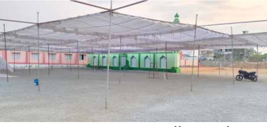
ప్రభావం వల్ల ఉదయం 9 గంటల లోపే ఈడ్గాల వద్ద ప్రత్యేక సమాజుల కోసం నిర్మాణాలు ఏర్పాటు చేస్తున్నారు. సమాజ్ కోసం వచ్చే భక్తులు వేసేవి తాపం దృష్టిలో పెట్టుకొని సమయపాలన పాటించాలని కోరుతున్నారు.

నాగర్ కర్నూల్ ఏప్రిల్ 10(పుదయం ప్రతినది) ముస్లింల పవిత్ర రంజాన్ మాసం బుధవారం సాయంత్రం నెలవంక కనిపించడంతో ముగిసింది. గురువారం రంజాన్ వంద గంటలకు ఈర్-ఉల్-ఫితర్ ప్రత్యేక సమాజ్ కోసం ఈడ్గాల వద్ద ఏర్పాటు జరుగుతున్నాయని ముస్లిం మత పెద్దలు తెలిపారు. నాగర్ కర్నూల్ జిల్లా కేంద్రంలోని శ్రీమఠం రోడ్డు వద్ద ఈడ్గా వద్ద మునిసిపాలిటీ అధ్యక్షులు ఏర్పాటులో ఘనంగా నిర్వహిస్తున్నారు. ఎండ వేడిని తట్టుకునే విధంగా పెండాల్స్, షామీయానాలు ఏర్పాటు చేస్తున్నారు. అదేవిధంగా నాగర్ కర్నూల్ మండల పరిధిలోని కుమ్మర్, తూడుకుర్తి, పెద్దాపూర్ తదితర గ్రామాలలో సైతం ఈడ్గాలను ముస్తాబు చేస్తున్నారు. నాగర్ కర్నూల్ జిల్లా కేంద్రంలోని ఈడ్గా వద్ద గురువారం ఉదయం 9 గంటలకు ప్రత్యేక సమాజ్ ఉంటుంది. వేసేయ