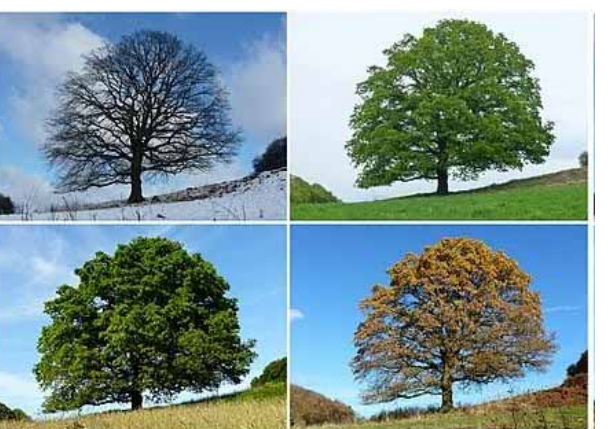
మకరసంక్రాంతి, శివరాత్రి, హోళి... భారతీయ పురాణాలలో, శరద్ఋతువు సరస్వతి దేవతకి ఇష్టపడే కాలంగా పరిగణించబడుతుంది, దీనిని "శరద్ఋతువు దేవత" (శారద) అని కూడా పిలుస్తారు. అలంకార కాస్త్రం నిర్మించిన అష్టాదశ వర్షనల్లో ఋతు వర్ష ప్రభాసమైనది కాబట్టి మన తెలుగు కాలాల్లో కూడా సాంధ్రాయంకంగా ఈ ఆరు ఋతువుల వర్షనే కనిపిస్తుంది.

నక్షత్రంలో పౌర్ణమి వస్తే వైశాఖంగా పిలువ బడింది. ఇదే విధంగా సూర్యునికి సంబంధించిన సంవత్సర కాలాన్ని 27 భాగాలుగా విభజించే సీ వాటిని కాలైలు అని అన్నారు. ఒక్కో నక్షత్ర కాలమిలో సూర్యుడు దాదాపు 2 వారాల పాటు ఉంటాడు కాబట్టి ఒక్కో కాలై సుమారుగా 13 రోజులు ఉంటుంది. అత్యని కాలై మొదలు రేపటి కాలై వరకూ సాగే ఈ కాలై విభజన వ్యవసాయ దారులకు చాలా ఉపయోగకరం. భారత దేశంలో ఆచరణలో ఉన్నట్టి ఆరు ఋతువులు. వసంత ఋతువు: చైత్రం, వైశాఖం సుమారు 20-30 డిగ్రీల ఉష్ణోగ్రత బెల్ల బిగురించి పూవులు పూ స్తాయి. వివాహాల కాలం, ఉగాది, శ్రీరామ నవమి, వైశాఖి, హనుమజ్జయంతి బిగ్గి ఋతువు: శ్రేష్టం, ఆషాఢం బాగా వేడిగా ఉండి 40 డిగ్రీల ఉష్ణోగ్రత, ఎండలు మెండుగా ఉంటాయి. వట పూర్ణిమ, రథాయాత్ర, గురు పూర్ణిమ బి వర్ష ఋతువు: క్రావణం, భారతపదం చాలా వేడిగా ఉండి అత్యధిక తేమ కలిగి భారీ వర్షాలు కురుస్తాయి. రక్షా బంధన, శ్రీకృష్ణ జనాష్టమి, వివాయక చుపితి, ???, శరద్ఋతువు: ఆశ్వయుజ, కార్తీకం. తక్కువ ఉష్ణోగ్రత, దుసరా సవరాత్రి, విజయ దశమి, దీపావళి, శరదీ పూర్ణిమ బిహూ, కార్తీక పౌర్ణమి బి హేమంతం ఋతువు: మార్గశిరం, పుష్యం, చాలా తక్కువ ఉష్ణోగ్రతలు (20-25) మంచు కురిసి, చల్లగా నుండు కాలము. పంటలు కోత కాలం. భోగి, సంక్రాంతి, కనుమబి శిశిర ఋతువు: మాఘం, ఫాల్గుణం, బాగా చల్లని ఉష్ణోగ్రతలు, 10 డిగ్రీల కంటే తక్కువ, ఆకురాల్య కాలం, ఉగాది, వసంత పంచమి, రథసప్తమి/