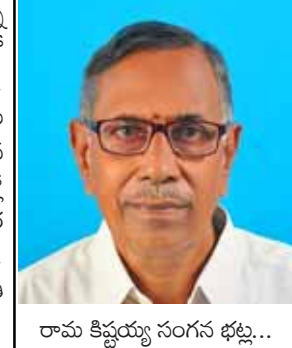
రామ కిష్టయ్య సంగన భట్ట...