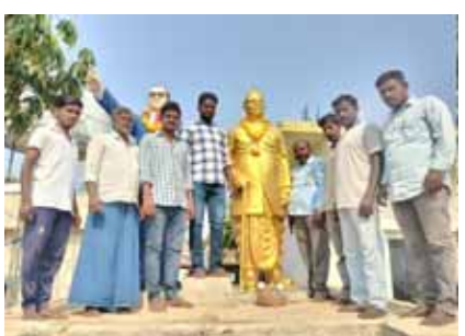
ఆదర్శంగా తీసుకొని ముందుకు సాగాలని ఆకాంక్షించారు. ఈ కార్యక్రమంలో గ్రామ పెద్దలు, ప్రజాప్రతినిధులు ప్రజలు పెద్ద సంఖ్యలో పాల్గొన్నారు.