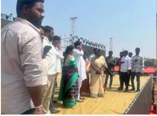
తాము అధికారంలోకి వస్తే అమలు చేయనున్న అయిదు గ్యారంటీలను కాంగ్రెస్ అగ్ర నాయకత్వం ప్రకటించనుంది అని మంత్రి వర్యులు దాక్టర్ సీతక్క అన్నారు

ములుగు, మార్చి 5, (పుదయం ప్రతినిధి): దేశ ముఖ్యమంత్రి మార్చి 5న కీలకమైన లోక్ సభ ఎన్నికలకు తెలంగాణ గడ్డ మీద నుంచే జంగ్ సైరన్ ఊదాలని పదేళ్ల పాటు ప్రతిపక్షంలో ఉన్న కాంగ్రెస్.. నరేంద్ర మోదీ నేతృత్వంలోని పదేళ్ల ఎన్డీఎ పాలనకు చరమగీతం పాడాలనే కృతనిశ్చయంతో ఉంది. ఈ క్రమంలోనే లోక్ సభ ఎన్నికలకు సంబంధించిన మేనిఫెస్టోను తెలంగాణ గడ్డమీద, అదీ శాసనసభ ఎన్నికలకు సమరశంఖం పూరించిన తుక్కుగూడ వేదికగానే విడుదల చేయాలని నిర్ణయించింది. ఈ నెల 6వ తేదీన తుక్కుగూడలో 'జనజాతర' పేరిట నిర్వహించే భారీ జనారంగ సభలో మేనిఫెస్టోలో పాటు